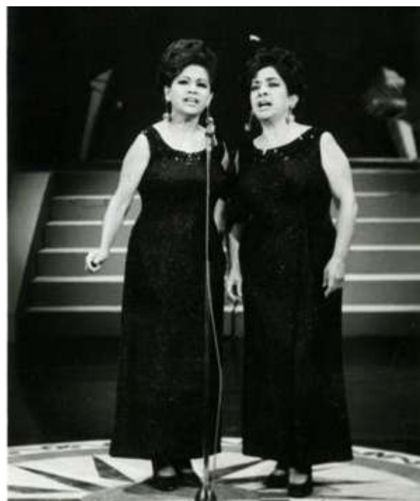
Las Limeñitas en el programa Danzas y Canciones del Perú, emitido por Panamericana TV. 17 de marzo de 1971.