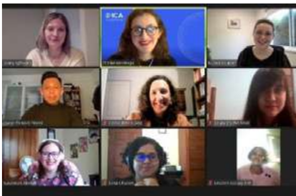
Primera reunión del Programa de Nuevos Profesionales.

Tras postular el año pasado, fui calificada para ser parte de este programa (2021-2022) junto con otras cinco personas de Estados Unidos, Noruega, Sudáfrica, Australia y Costa Rica, para participar y presentar un proyecto en la Conferencia de Roma 2022 "Archives: Bridging the Gap".