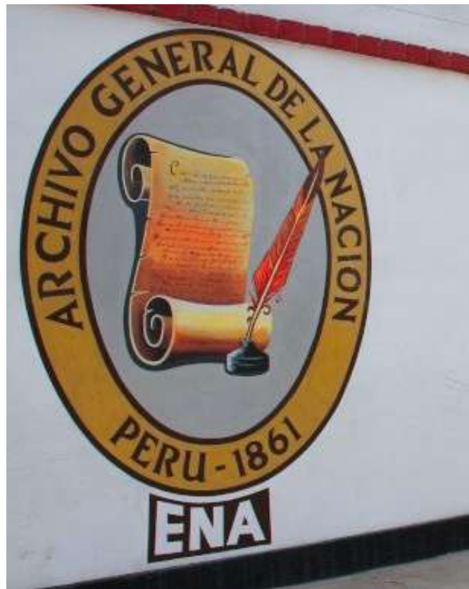
Frontis de la Escuela Nacional de Archivística

Los cursos desarrollados en el periodo 1982-1990 tuvieron diversas modalidades, pero