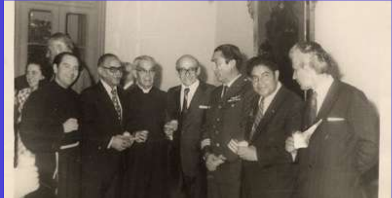
Don Guillermo Durand Flórez en el Primer Seminario Multinacional sobre Planificación y Reorganización de Archivos Nacionales, organizado por el Archivo General de la Nación con el apoyo de la Organización de Estados Americanos. Lima, del 1 al 6 de abril de 1975.

En este largo periodo de su vida institucional destacamos la insigne figura del doctor Guillermo Durand Flórez, quien el 2 de julio de 1964 ingresa en funciones como director del Archivo Nacional. Su labor partió de un análisis situacional de la institución, por lo que concluye que los archivos se encontraban en un deplorable estado, debido a la escasez de recursos económicos, así como a la ausencia de leyes que regulen e impulsen el desarrollo armónico de los archivos. En razón de ello, trabajó por más de veinte años para cumplir su principal propósito: cambiar totalmente la institución que recibió y, por ende, la archivística nacional. Para ello, transformó la multitud de archivos inconexos e ineficientes en un solo sistema interconectado que se caracterizaba por poseer normas generales involucrando a todos los archivos, desde los pequeños