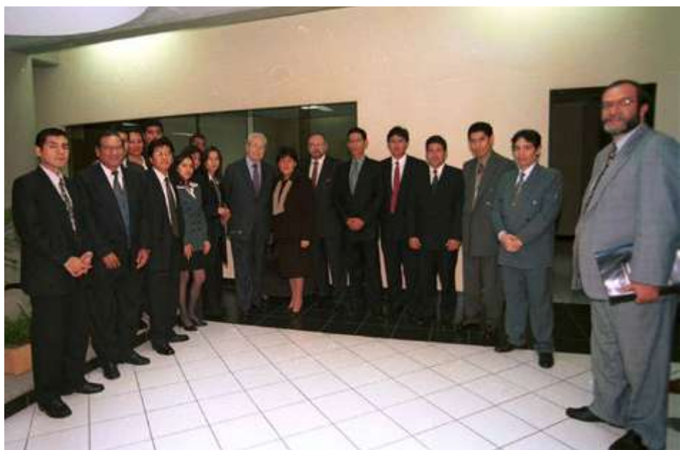
Ceremonia de inauguración del Archivo Central. El canciller, Javier Pérez de Cuéllar junto a Yolanda Biso Drago y el equipo del Archivo del Ministerio. Mayo, 2001.

Es una satisfacción comprobar que los documentos convertidos en evidencia y testimonio de los hombres y mujeres que construyeron esta institución sirven hoy y continuarán sirviendo mañana para conocer la historia, defender derechos y contribuir a una buena gestión de la Cancillería. El Archivo del Ministerio de Relaciones Exteriores es sin duda memoria viva, cuidada y protegida para las futuras generaciones.