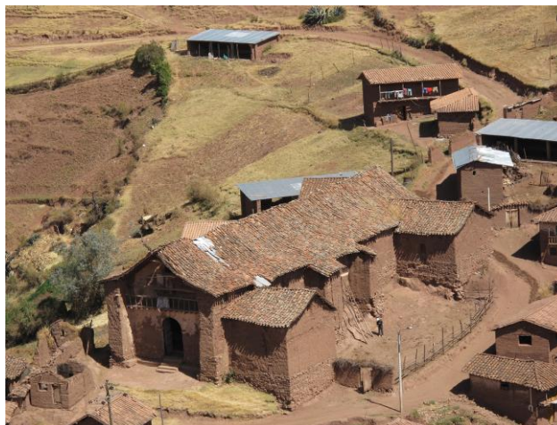
La Iglesia de Santiago Apóstol de Kuño Tambo en Acomayo, Cuzco, Perú, otra edificación del Proyecto de Estabilización Sismorresistente que representa edificaciones eclesiásticas en los Andes. Esta iglesia construida con muros gruesos de adobe y cubiertas de armadura de madera (par y nudillo) se edificó en 1681 y se decoró con pinturas murales del mismo período. El GCI está trabajando con el Ministerio de Cultura, sede Cusco para la restauración y estabilización sismorresistente de esta importante iglesia. Foto: Wilfredo Carazas, 2010.

“Estos tipos de construcciones de tierra han logrado sobrevivir en una región azotada por terremotos, pero es necesario intervenir para asegurar que daños adicionales sean mitigados”, afirma la Señora Susan Macdonald, jefa de proyectos de campo del Getty Conservation Institute. “El GCI está comprometido a